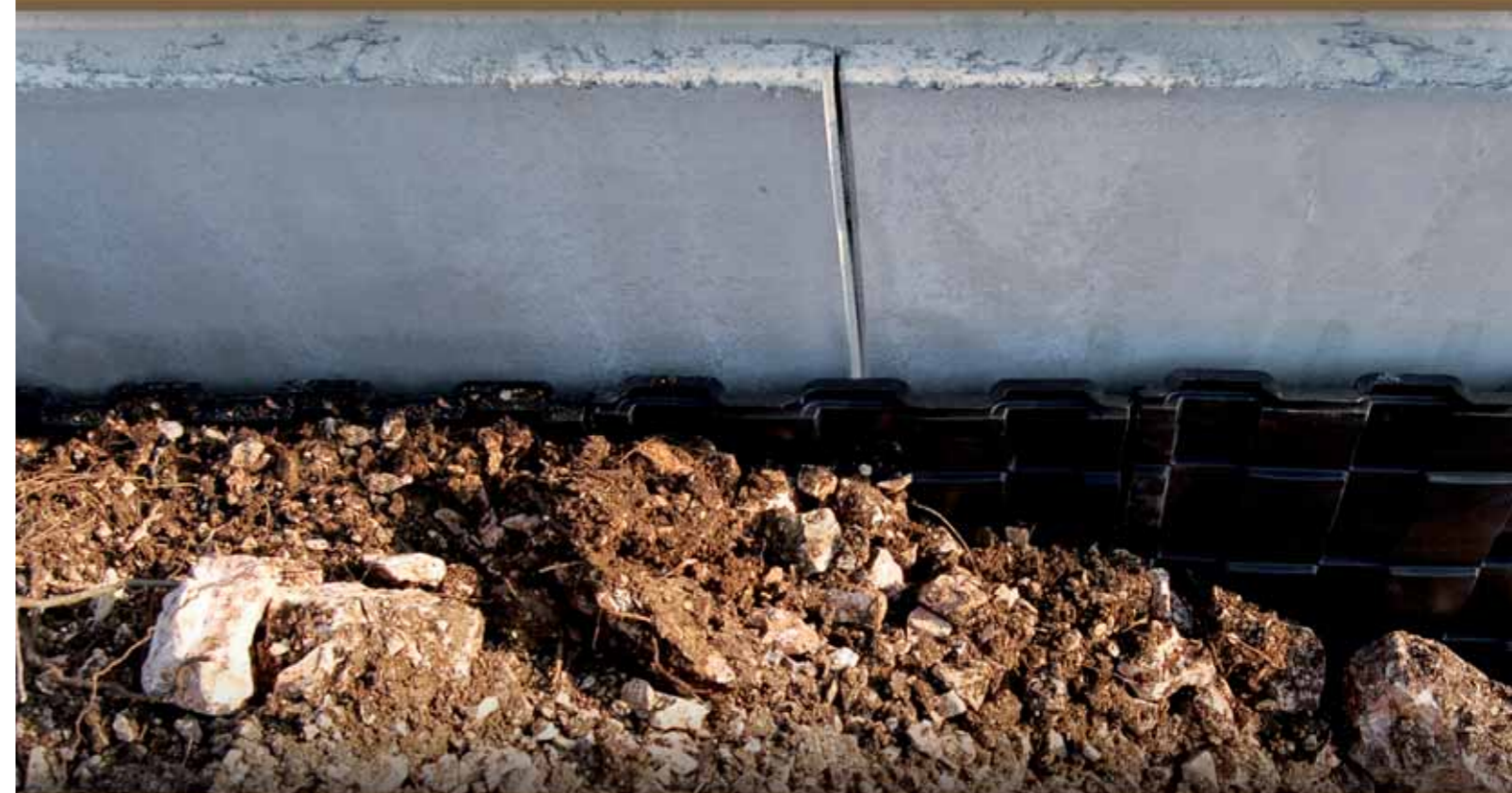
La défense des murs contre terre