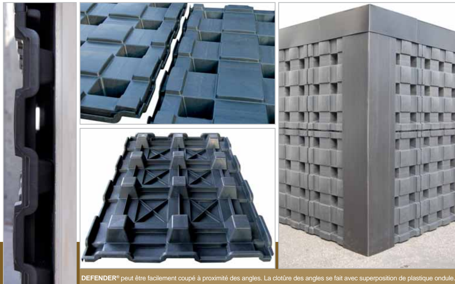
DEFENDER® peut être facilement coupé à proximité des angles. La cloture des angles se fait avec superposition de plastique ondule.